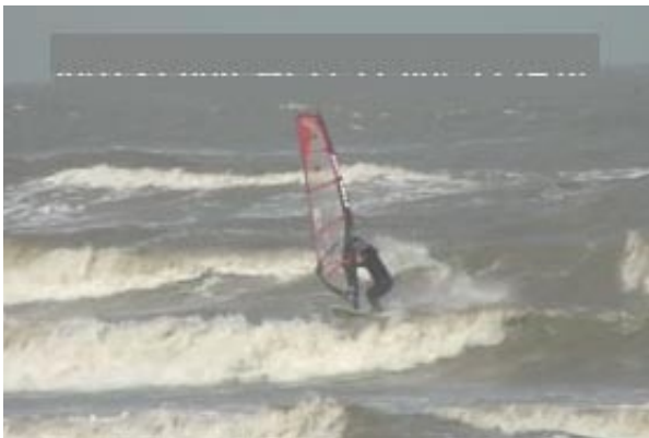
windsurf news 04

荷物を受け取り今回もお世話になる SPOT のトニーが手配してくれたお迎えタクシーさんを探すが、ない！だが、「STOP」とカードを持ってるヒトが……。結局この車だったあ！今後台湾ツアーに参加する方に御忠告。前回は「WING SURF」とお迎えが来てました☆御注意ください!!