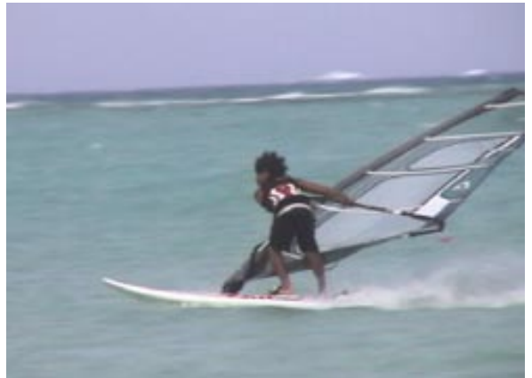
サイパンは上級者のライディングを間近で見られることがメリットの1つ