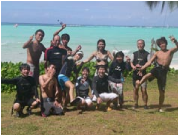
友人・仲間が増えていくのもツアーの楽しみの1つ

ウインドを初めて1年目の時に初めてサイパンツアーに参加し、それ以来サイパン大好き♡人間になってしまった私は、今年で5年連続5回目のツアー参加でした。今回、いつもと違っていたのは3泊4日(ある意味2泊3日)という、かなり短い日程だったのです。毎年1週間は参加していたのですが、今年は3日間しか休めず、最初は今年のサイパンはあきらめていました。が、N先生の巧みな話術(?)にのせられ、どうしてもサイパンに行きたくなくなってしまったのです。夕