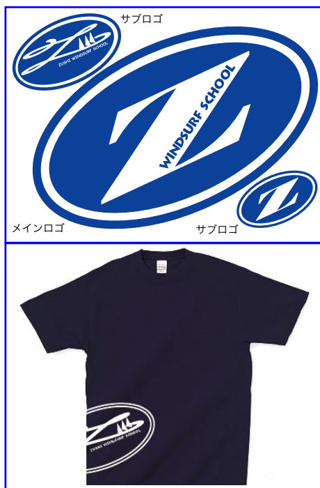
注：写真のTシャツはイメージです

※ロゴのリニューアルに伴い、新しい会員証を同封してあります。旧会員証と差し替えてください。