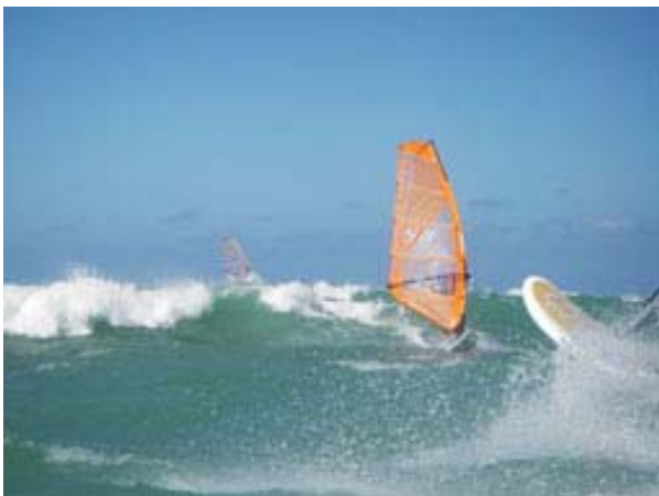
windsurf news 02