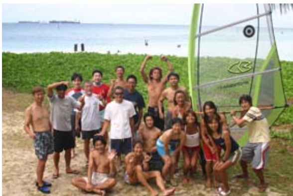
「出会い」ってほど、大げさではないけれど、初めて会う人や、普段はあまり話をしない人ともいつの間にか仲間に!

この2週間はウインドの技術が毎日進歩していく充実感で、嬉しくて嬉しくて朝から夕方までずっとウインド。そして、その後の夜も大満喫。なんといっても一番盛り上がるのは、バーベキューだ!!開放的なビーチで、ウマイものをたくさん食べた後、ついにゲーム開始。罰ゲームはテキーラだ。暑いサイパンで飲むテキーラは最高にウマイ!って思ったのも最初だけで後は味なんか感じなくなり、大騒ぎ。つーかね、テキーラ