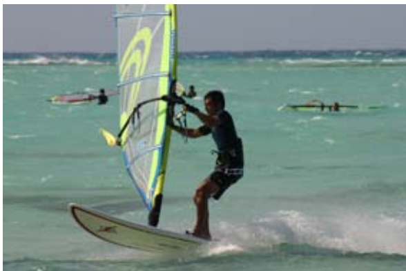
ウォータースタートの練習、ジャイブの練習となんでもあり。とにかく練習しやすいゲレンデです。

それまで苦しんでいたセイルの重さが突然消え、まるでボードにエンジンが付いたように、青い海面を爆走した。初プレーニングは、今まで経験したことのない不思議なスピード感・心地良さで、ウインドが全く違う乗り物に進化したことにビックリして、今でも驚きが治まらないよ。