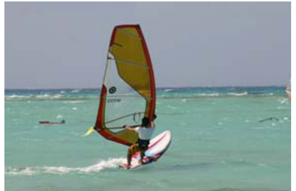
なりふり構わずプレーニングしていったとしても、アウトで足が届くから安心。思い切りよくチャレンジできる。

最初の数日間は爆風ではなく、「サイパンなんて全然ヨユーじゃん」となめ始めていた。そんな時だった、ついにサイパンらしい爆風が吹きやがった。いやー吹っ飛ばされまくったね!!サイパンに来て上手くなったと調子に乗っていたが、やっぱり気のせいだったみたい。上手い人達がプレーニングしているのを見ながら、海に浸かっているのは、めちゃくちゃ悔しい、負けたくない、これじゃあまた「弱っち」と呼ばれちゃう。でもこんなコンディションで特訓してこそ憧れのプレーニングにつながると思えば、吹っ飛ばされてもついニヤけてしまう。そしてついに9日目にイントラのアドバイスのおかげで念願のプレーニングに成功。何だこりゃ!!