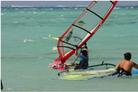
大半が足の届く深さだから、ビーチスタートの練習もバツチリ。この浅さがフラットウォーターを造り出している。

サイパンに2週間行っちゃいました。僕はこの時、ウィンドを始めて半年で、プレーニングができないどころか、道具を手に入れたばかりで、逗子でも、「ヒー!」って感じ!!サイパンの噂を聞くのは、爆風、そして手の豆が潰れて痛い、さらに痛んだ手にアロンアルファ!?を塗り、イントラでさえ日焼けがヤバイなど、その頃の僕にとっては恐ろしい話ばかりでかなりビビリまくり。ただマイクロビーチからマニャガハ島にウィンドで行くと、モテモテという夢のような話を聞き、めちゃくちゃ行きたくなり、とにかく寒すぎる2月の日本を脱出し、サイパンに向かいました。