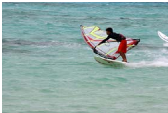
イントラにとってもサイパンは絶好の練習ゲレンデ。スピードやジャイブの見直し、フリースタイルといったメニューをこなしている。

だってまだウインドの腕が足りないんだもん!またサイパンに絶対行くぞ、カッコいいジャイブ・バルカン・フォワードできるようになりてー!!