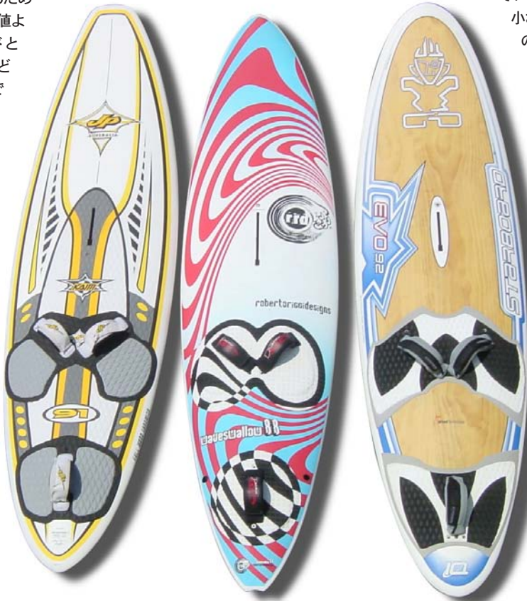
JP AUSTRALIA REAL WORLD WAVE

でなく、ウェーブのうまい人にも勧められるボードだという結論に達しています。この冬、あるいは春に向けてウェーブに取り組もうという方、ウェーブは持っているけれど、なかなかうまく乗れないという方、微風用の1本を持とうと考えている方、逗子のコンディションでフロントサイドをうまく攻めたいという方々にオススメのボードです。必ずウインドサーフィンを楽しめる幅が広がってくることでしょう。少しでも興味があったら、インストラクターやCBに尋ねてみてください。