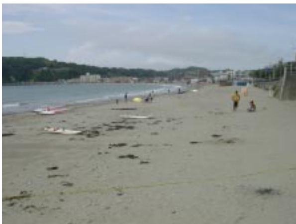
写真による東浜の様子。遠くに見えるトイレ付近までが出艇可能なエリアです。

東浜の出艇エリアは、海水浴場との境となるワイヤーから、ジェットの出艇用に区切られたロープまでの間です。ビーチは広くなりましたが、風の舞うところはまだまだ健在ですので、道具の置き方、運び方など、気を抜かないようにしましょうね。