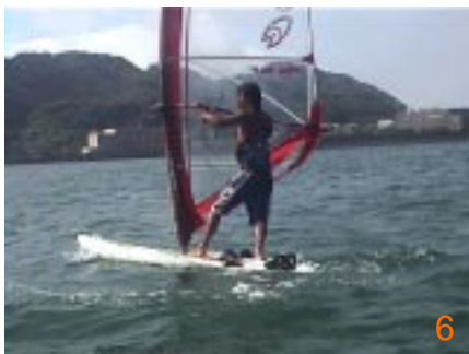
6': セイルを返さずにボードを360度回してしまうのが「アップウインド360」。セイルを返す動作になっしまわないように、更にボードだけを回し込んでいきます。