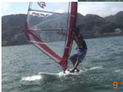
9':ランニングを越えたらセイルの下にボードを押し込むようにしてラフさせましょう。