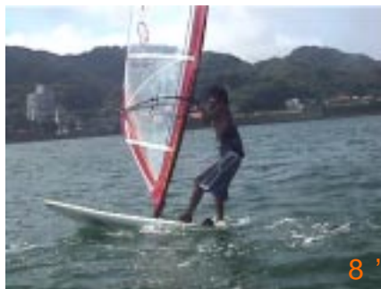
8':後ろ足加重を意識し、後ろ足を軸にボードを回します。風が入り直してセイルが開かれますが、それに逆らわないようにセイル手をマスト手に近づけて手幅を狭くします。セイルをシバーさせるくらいのもいいでしょう。

最近様々なフリースタイルが登場していますが、ここでは基本的なフリスタを解説していきます。多少自己流の所もありませんが今回はヘリタックとアップウインド360になります。フリースタイルを行う際に認識していただきたいのが、ベースとなる技が全部で4つあるということ。ボード360、セイル360、ヘリコプター、リーワード。これらを応用して使ったり、組み合わせて使うことで様々な技が完成します。もちろんヘリタックやアップウインド360もそうです。