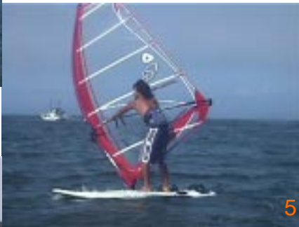
5: ヘリタックはここからセイルを返しに行きます。広げたセイル手が体の中心に来るまでマストを移動したら、倒していたマストを起こし始めます。

写真6以降はヘリタックとアップウインドと分かります。ヘリタックはそのままセイル返しになり、アップウインド360はそのまま裏風を使いペアさせていただきます。