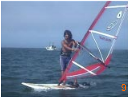
9:最後はジャイブと同じセイル返しです。マストに振り回されないように、しっかりと脇を締めて返すように心掛けましょう。

フリースタイルといわれると難しく考えてしまいがちですが、根本は好きなように楽しく遊ぶ！！というのが発祥であり、決まったことを決められたままやっても面白くありません。こんなにたくさんあるフリースタイルもやり方は人それぞれ。自分なりに組み合わせや楽しみ方を見つけてみて下さい。