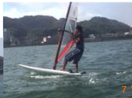
7':後ろ足加重を意識し、マストでノーズが押される感じをつかめれば成功するでしょう。セイルが軽く感じられるようになったら意識的にセイルを開いてマストを引きつけ始めます。