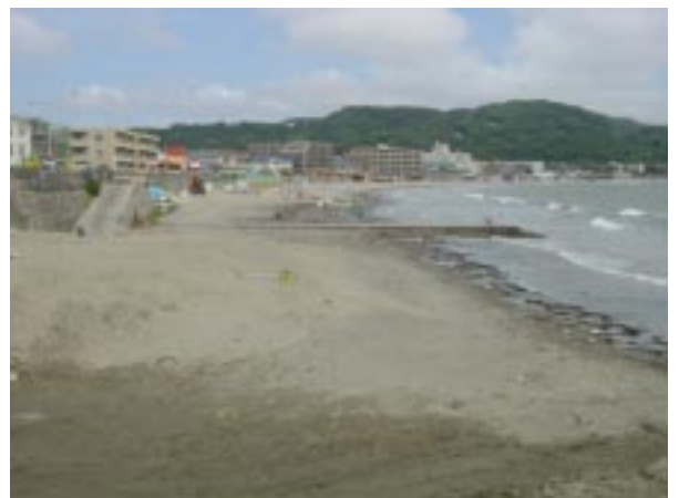
写真による西浜の様子。大潮の満潮時にはかなりビーチが狭くなるので注意。

西浜は半分が岩場というイメージでいいでしょう。BFのメンバーは慣れているために、どのあたりが岩場かを把握していると思いますが、他の艇庫のメンバーが出艇するには注意が必要です。また、県営駐車場脇のために、一般のバーベキューも多いので、注意したいところです。