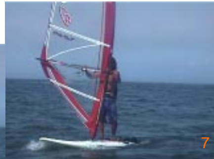
7:ブームエンドをノーズに突き出すようにしながらマストを体に引き寄せます。同時に前足だった足を開きセイルとのバランスをとります。クリューファーストの状態になるとセイルに引っ張られるので後ろ足は早めに開いておきましょう。

最近様々なフリースタイルが登場していますが、ここでは基本的なフリスタを解説していきます。多少自己流の所もありませんが今回はヘリタックとアップウインド360になります。フリースタイルを行う際に認識していただきたいのが、ベースとなる技が全部で4つあるということ。ボード360、セイル360、ヘリコプター、リーワード。これらを応用して使ったり、組み合わせて使うことで様々な技が完成します。もちろんヘリタックやアップウインド360もそうです。