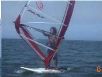
8:そのまま動作を止めずにセイル手を離し、セイルを返します。ここで敢えてクリューファーストの体勢で動作を止める事ができれば、リカバリーが上手くなります。