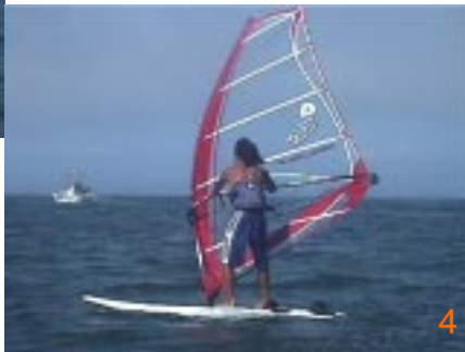
4: 下の写真のようにマスト手でセイルをリードしながらノーズ方向に移動していきます。風を入れすぎないようにセイル手の力を抜いておくのがポイントです。