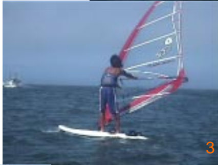
3: セイル手は使わずマスト手でゆっくりと裏風が入らないように風向にむかってマストを送り込んでいきます。