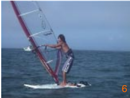
6: 後ろ足を前足にクロスして後ろ手を中心にマストをジョイントの上に戻ってくるように起こし始めます。