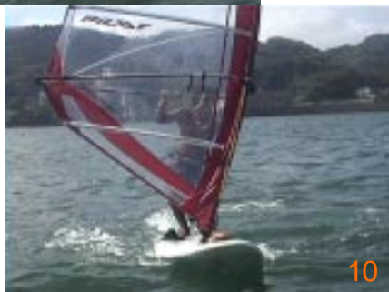
10':アビームまでボードが向いたら足のポジションを通常のセリングに入っていきます。